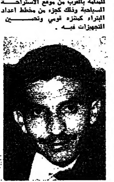
إلى نائب رئيس سلطة المصادر الطبيعية